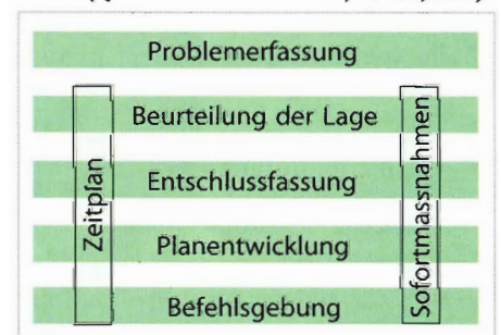
Abb.2: Entscheidungsprozess der Schweizer Armee (Quelle: Schweizer Armee, 2004a, S.58).

Bei der Beurteilung der Lage werden entscheidungsrelevante Konsequenzen aus den